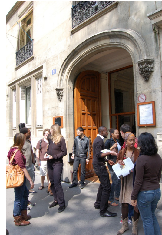
Entrée d'un des bâtiments de AUP 31 avenue Bosquet